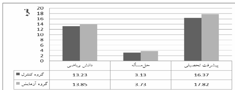
نمودار ۱. نمودار ستونی مقایسه‌ی میانگین نمرات دو گروه کنترل و آزمایش در پس‌آزمون

سه فرضیه‌ی اساسی در رابطه با این سوالات در نظر گرفته شد. برای بررسی این فرضیات، در یک نیم‌سال تحصیلی روش تدریس مبتنی بر سازنده‌گرایی برای گروه آزمایش و روش تدریس متداول (سنتی) برای گروه کنترل به اجرا در آمد. و میانگین حاصل از نمرات پیش‌آزمون، پس‌آزمون و دو آزمون تکوینی با استفاده از آزمون t برای دو گروه مستقل و t جفتی مقایسه شدند. نمودار شماره ۱، میانگین نمرات دو گروه کنترل و آزمایش را در دانش ریاضی، حل مسأله و پیشرفت تحصیلی در درس ریاضی نشان می‌دهد.