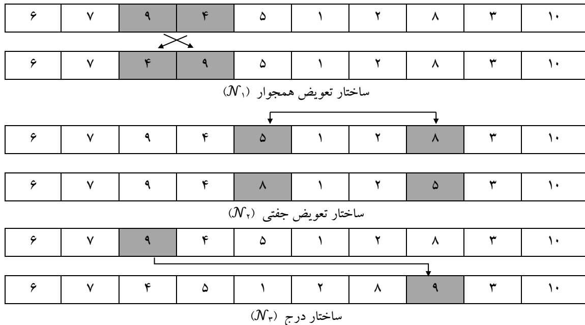
شکل ۴. ساختار همسایگی‌ها در الگوریتم جستجوی محلی

گام ۵: اگر l = 4 ، قرار دهید l = 1 و به مرحله ۲ بروید، در غیر این صورت به مرحله ۲ بروید.