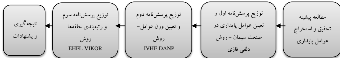
شکل ۱. مراحل تحقیق

توصیفی پیمایشی است. در این تحقیق از سه پرسشنامه استفاده شده و در اختیار خبرگان دانشگاهی و حرفه‌ای قرار گرفته که در زمینه مدیریت زنجیره تامین با رویکرد مذکور آشنایی داشته و به روش نمونه‌گیری غیراحتمالی قضاوتی و از طریق تکنیک گلوله برفی انتخاب شده‌اند. مراحل تحقیق در شکل ۱ آمده است.