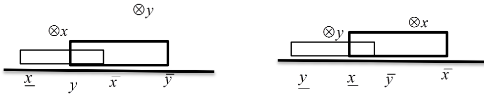
شکل ۲. بازه هایی که با هم اشتراک جزئی دارند.