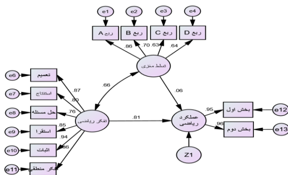
شکل ۴. مدل ساختاری پژوهش در دانش‌آموزان پایه نهم با برآورد ضرایب استاندارد

شکل ۳ مدل ساختاری پژوهش در دانش‌آموزان پایه هشتم و شکل ۴ مدل ساختاری پژوهش در دانش‌آموزان پایه نهم با برآورد ضرایب استاندارد را نشان می‌دهد. مشاهده می‌شود مقدار ضریب مسیر بین دو متغیر تفکر ریاضی و عملکرد ریاضی در مدل دانش‌آموزان پایه هشتم و نهم به ترتیب برابر 0.53 و 0.81 بوده که در گروه دانش‌آموزان پایه نهم بیشتر از دانش‌آموزان پایه هشتم می‌باشد.