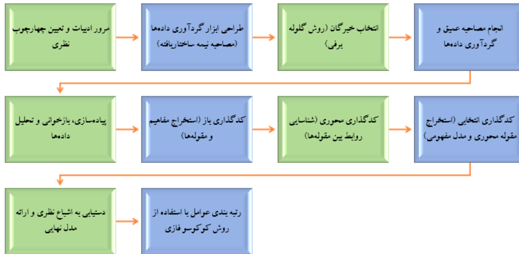
شکل ۱. مراحل اجرای پژوهش

نتایج حاصل از کد گذاری محوری با ۷۶ مفهوم اولیه حاصل از کد گذاری باز مفاهیم در متن مصاحبه‌های انجام شده که در قالب ۴۲ مقوله فرعی و ۲۷ مقوله اصلی دسته‌بندی شدند.