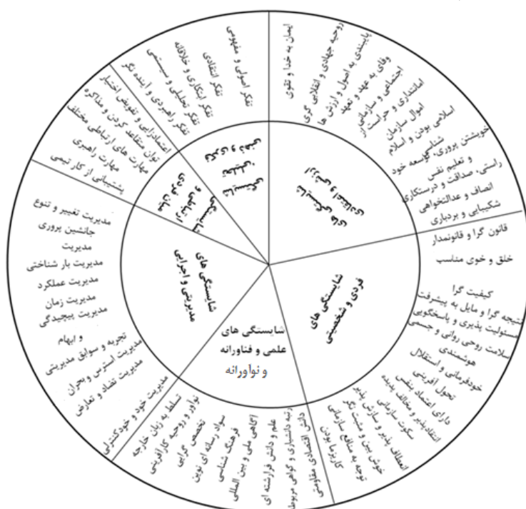
شکل ۲. الگوی شایستگی بهینه‌سازی شده مدیران دانشگاهی

گام نهایی در تحقیق حاضر پیشنهاد الگوی شایستگی برای گزینش مدیران دانشگاهی براساس سند دانشگاه اسلامی و متناسب با اصول عام و خاص دانشگاه اسلامی و اهداف آن طبق شکل ۲ می‌باشد.